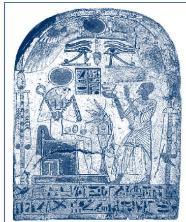
Figure 3. Le soleil « ailé » de l'Égypte ancienne (représentation d'une éclipse solaire totale ?). Peinture sur bois (Louvre).