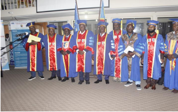
Photo de la soutenance