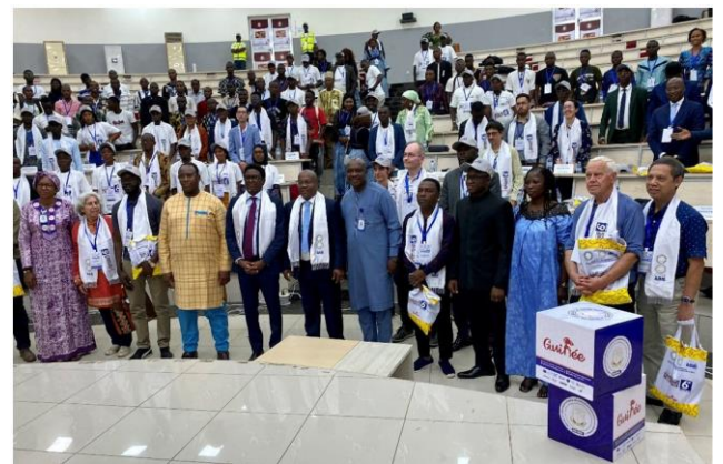
Photo de la cérémonie d'ouverture