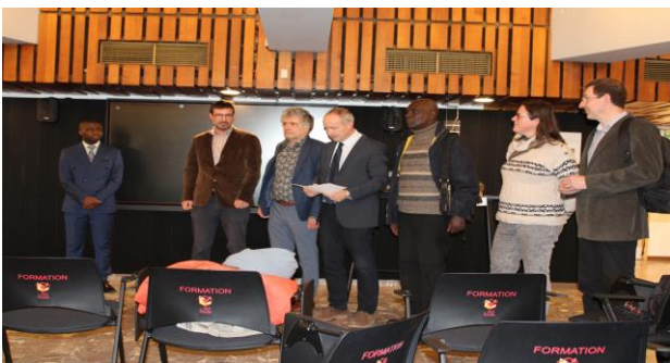
Photo de la soutenance

Titre de la thèse soutenue en anglais : « First MAX-DOAS observations of tropospheric NO 2 and H 2 CO in Central Africa: impact on air quality and validation of the TROPOMI satellite instrument »